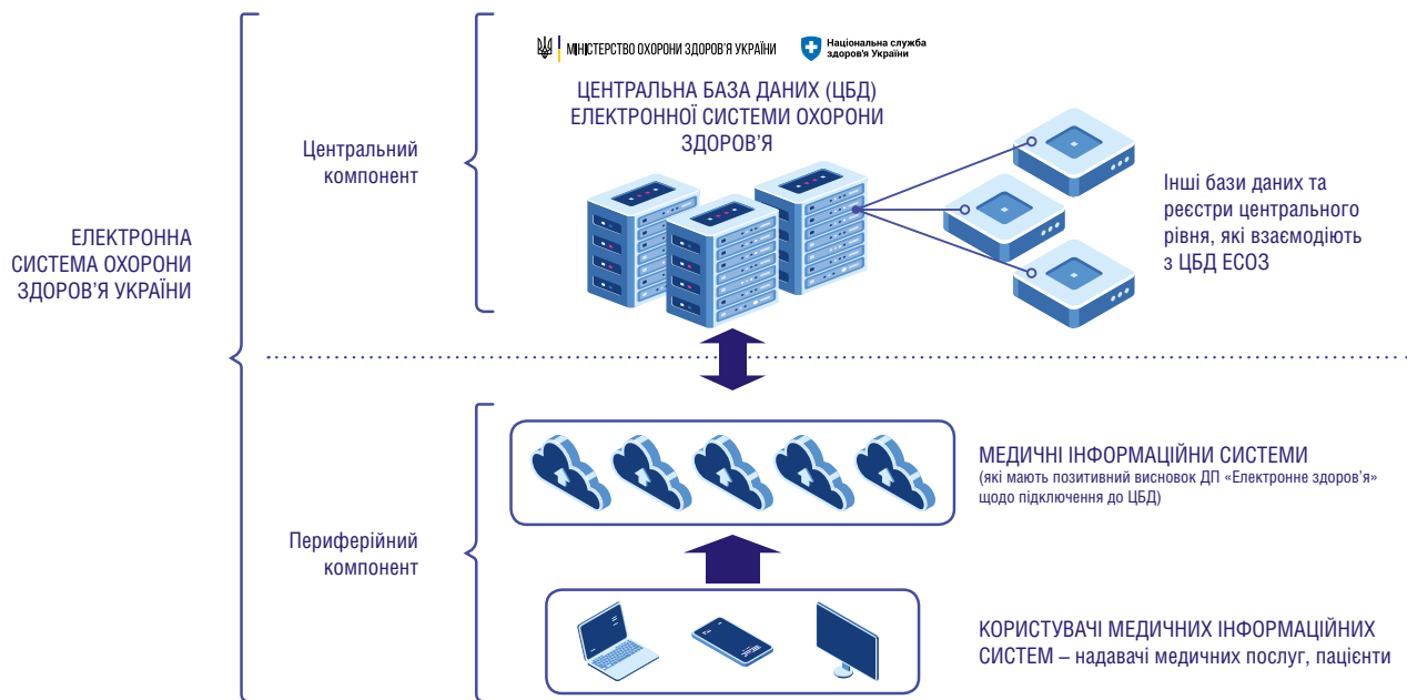
Рисунок 1. Архітектура ЕСОЗ в Україні

Інформаційна архітектура ЕСОЗ дає можливість використання знеособлених медичних записів з метою їх обробки для різних практичних та наукових завдань.